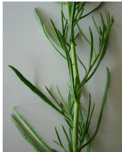
Schmale Blätter, Rand gezähnt oft ganzrandig erscheinend da zurückgerollt