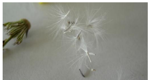
Früchte mit aufgesetztem Pappus (weisser Haarkranz = umgewandelter Kelch)