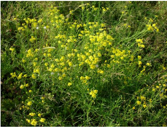
Bestand Senecio inaequidens , Autobahn Lausanne-Genf